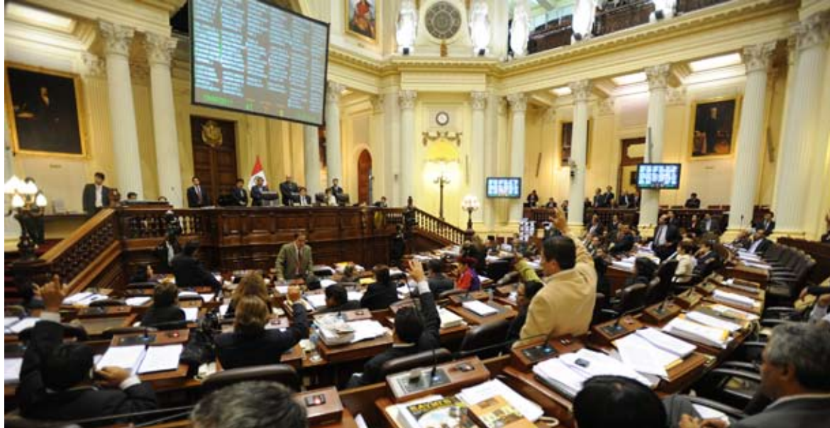
Pleno del Congreso de la República acogió propuestas legislativas de la Corte Suprema.