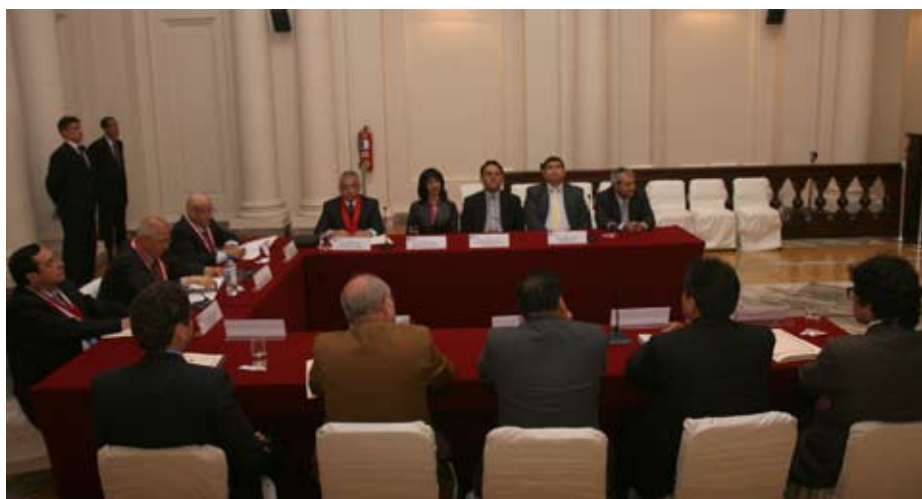
Integrantes de grupo de trabajo durante instalación.

Aseguró de antemano que esta Comisión hará un trabajo de calidad en virtud del alto nivel profesional y técnico de sus integrantes. ■