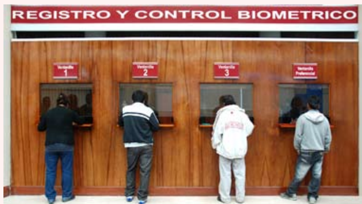
Procesados libres están obligados a acudir a registrarse cada mes para el control respectivo ante la autoridad judicial.