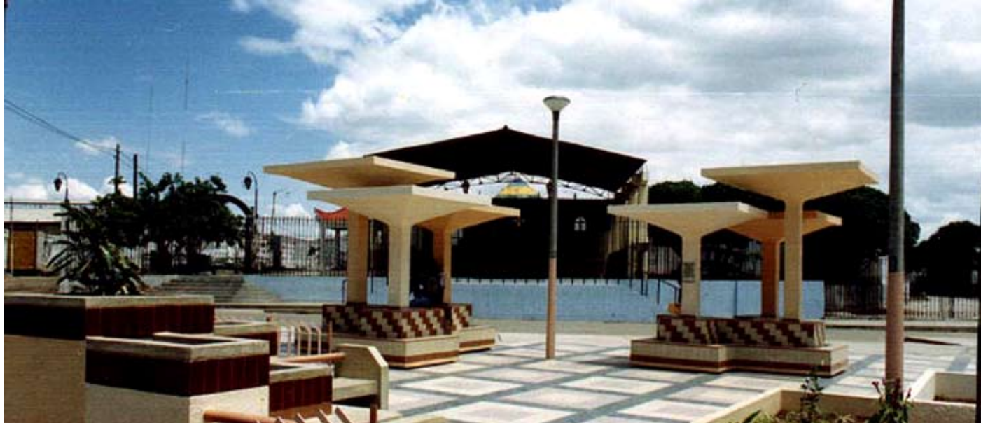
A partir del 1 de Julio funcionará nueva corte en la provincia de Sullana.