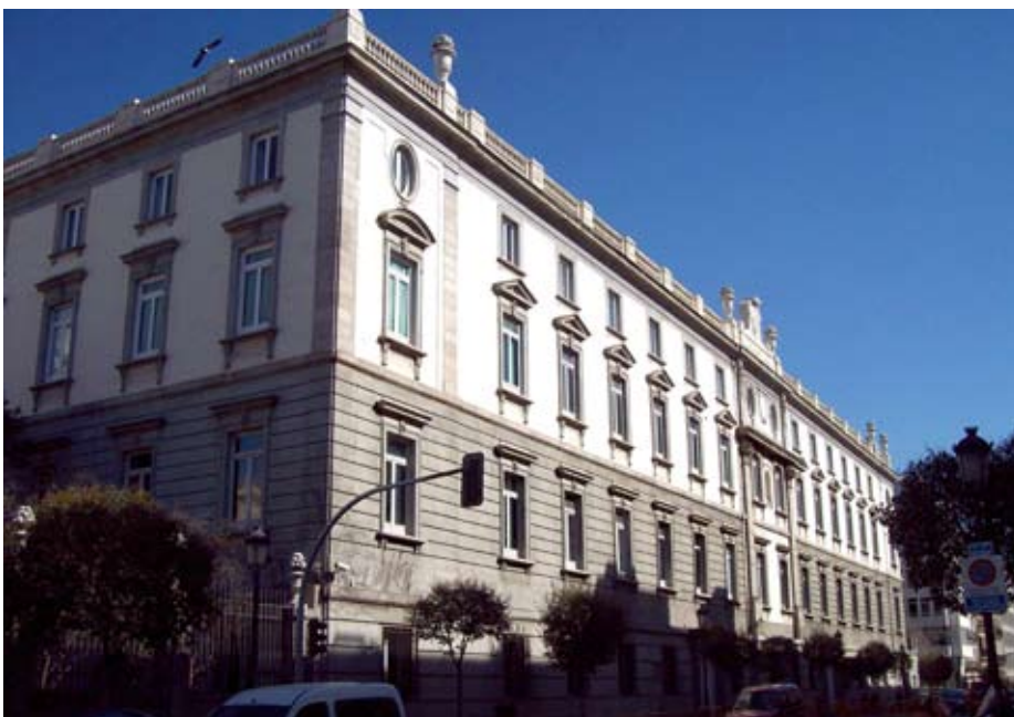
Sede del Consejo General del Poder Judicial español.