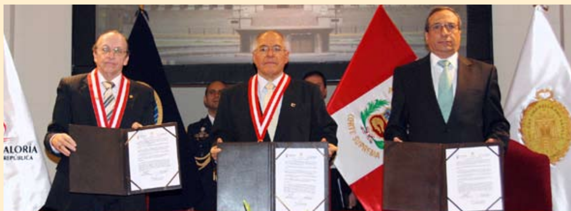
Ministerio Público José Antonio Peláez Bardales Fiscal de la Nación

El compromiso de las instituciones que representamos de ejercer una acción firme y coordinada en la lucha contra la corrupción, potenciando el accionar funcional que nos vincula en los procedimientos de detección, investigación, juzgamiento y sanción de los actos de corrupción, ya existentes o que puedan presentarse, con el objetivo de lograr un resultado efectivo que genere y recupere la confianza de la ciudadanía en las institucionalidad del Estado, propiciando así una sociedad más justa en la que se respeten los valores morales y éticos; y en la cual prime la transparencia y eficiencia en la gestión pública como medios para alcanzar el desarrollo de nuestra sociedad y el bienestar de todos los peruanos.