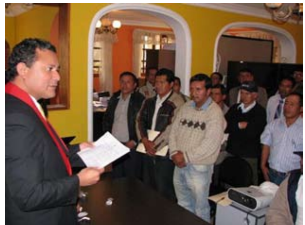
Presidente de la Corte Superior de Cajamarca con operadores de justicia local de Contumazá.

El Presidente de la Corte Superior de Justicia de Cajamarca, Percy Horna León, inauguró el primer taller con operadores de justicia local de Contumazá, gracias al apoyo del proyecto PROJUR, y destacó trabajo coordinado con los operadores de justicia ordinaria y comunal.