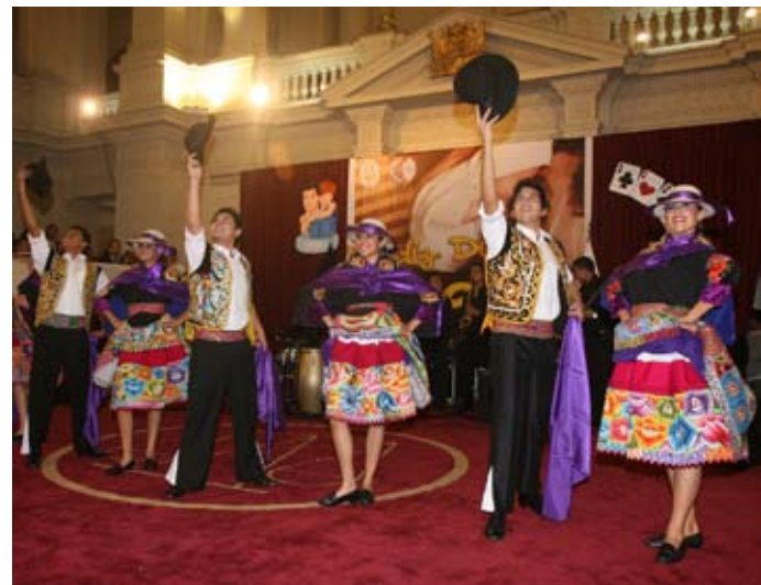
Grupo de danza interpreta un ritmo andino.