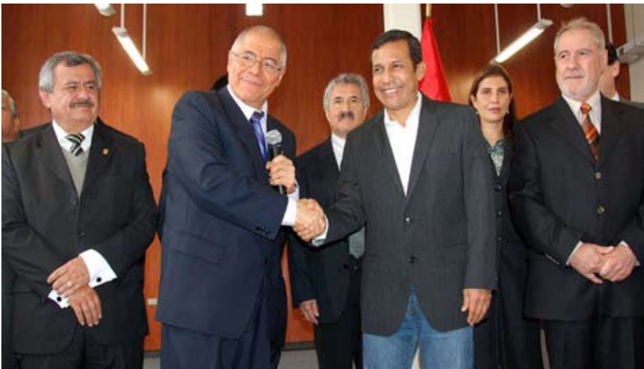
Jueces Supremos intercambiaron ideas con el presidente electo Ollanta Humala.