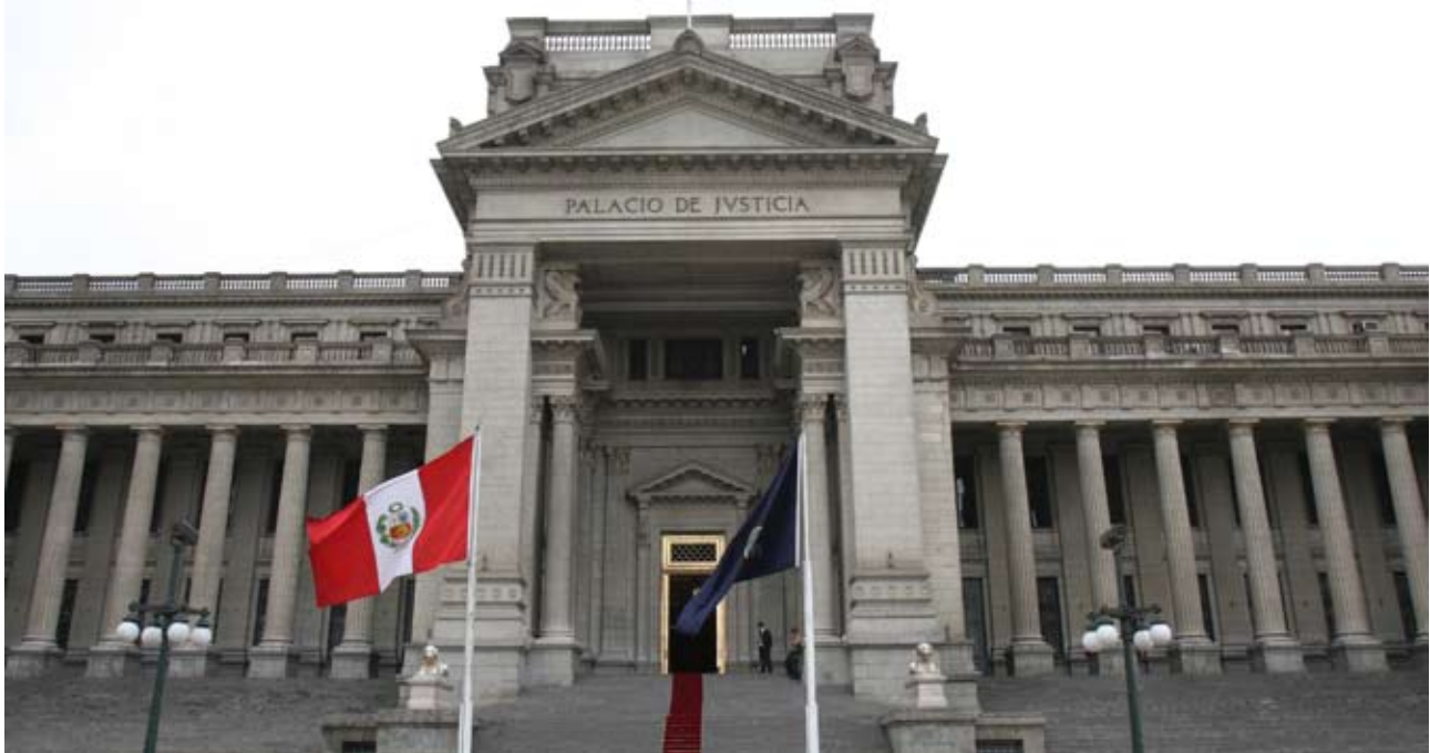
Poder Judicial espera se le entregue el presupuesto aprobado para el próximo año.