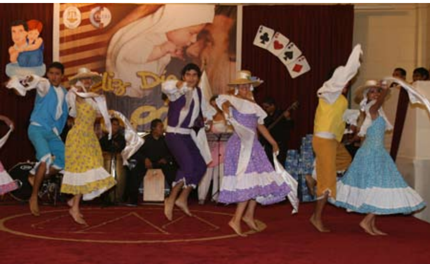
Grupo artístico deleita a los asistentes al homenaje.