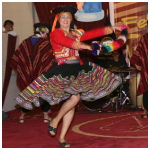
Hermosa danzante en pleno derroche de garbo y belleza.