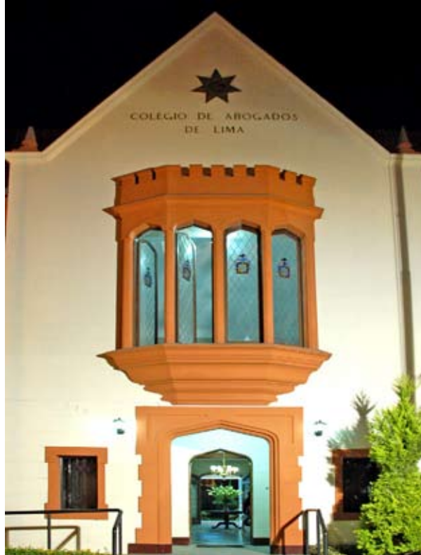
Colegios de Abogados están representados en OCMA y ODECMAS.

● Para que instituciones de sociedad civil asuman pago de sus representantes ante las ODECMAS hasta que MEF otorgue partidas.