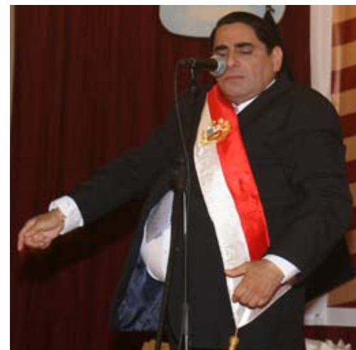
Cómico Carlos Alvarez en una de sus celebradas imitaciones.