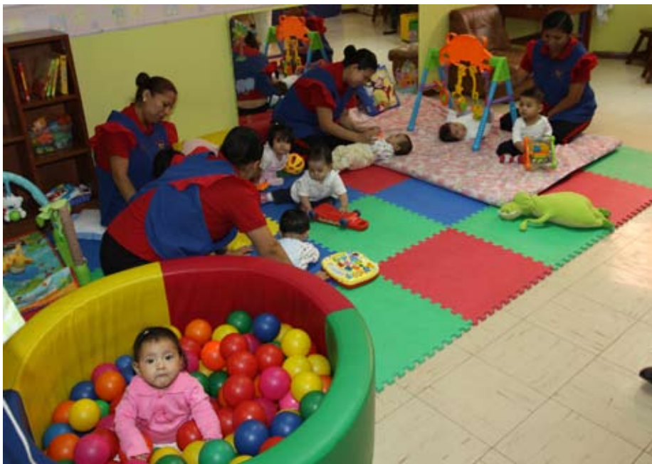
Con firma de acuerdo se podrían implementar wawa wasi en todas las sedes judiciales.

● Para atender a la niñez y apoyar a las madres trabajadoras judiciales.