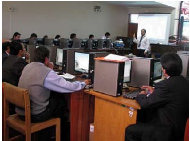
Jueces de Paz No Letrado capacitándose con modernas computadoras.