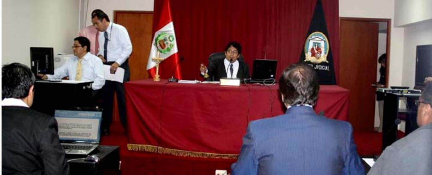
Jueces del todo el país ya aplican el Nuevo Código Procesal Penal para delitos de corrupción.