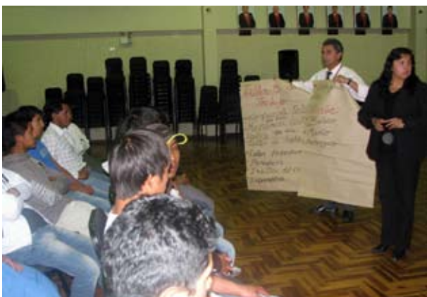
Equipo multidisciplinario en un taller con menores infractores.

Los temas que se desarrollan están relacionados con los derechos y responsabilidades, toma de decisiones, autoestima e identidad, comunicación, asertividad, sexualidad y adolescencia, maltrato y violencia, abuso sexual y otros; para generar una confianza de forma cooperativa y lograr cambios sustanciales en la conducta que conlleve a una reinserción efectiva en la sociedad.